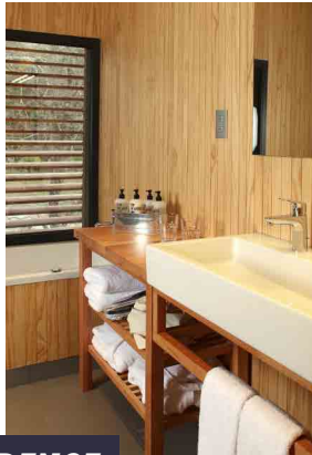
RESIDENCIA / RESIDENCE