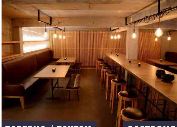
TABERNA / TAVERN