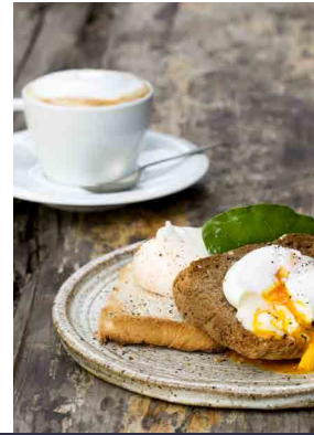
GASTRONOMÍA / GASTRONOMY

50 habitaciones, todas con vista al Parque, para ese merecido descanso tras un día de trabajo o para desconectarte y disfrutar durante el fin de semana.