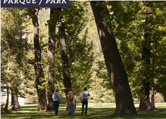
PARQUE / PARK